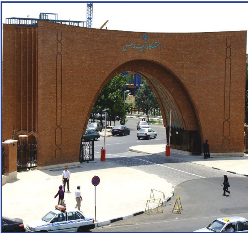
در جلسه شورای فرهنگی و اجتماعی مطرح شد: