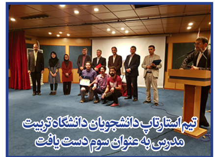
تیم استازای دانشجوین دانشگاه تربیت مدرس به عنوان سرگرم دست یافت

اولین شماره فصلنامه علم ورزش با صاحب امتیازی انجمن علمی - دانشجویی فیزیولوژی ورزشی چاپ و منتشر شد. زمان و مدت مصرف مکمل‌های رژیمی، مروری بر ویژگی‌های جسمانی و فیزیولوژیکی ورزشکاران نخبه رشته‌های برخوردی، عضله اسکلتی و دوران سالمندی با تأکید بر نقش فعالیت بدنی، تأثیر فعالیت‌های ورزشی بر مادر و جنین در دوران بارداری، روش‌های پیشگیری از ایجاد نارضایتی درباره شکل و ظاهر بدن زنان در سنین مختلف از مهم‌ترین عناوین منتشر شده در این شماره است. این نشریه با مدیر مسئولی افسانه جمالی و سردبیری محمدمطاهر افشون پور در ۹۰ صفحه سیاه و سفید چاپ شده است.