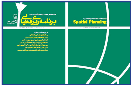
انجمن علمی - دانشجویی برنامه ریزی آمایش سرزمین برگزار کرد: